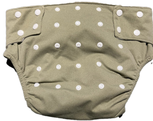
Couches lavables pour les femmes souffrant de fistules obstétricales